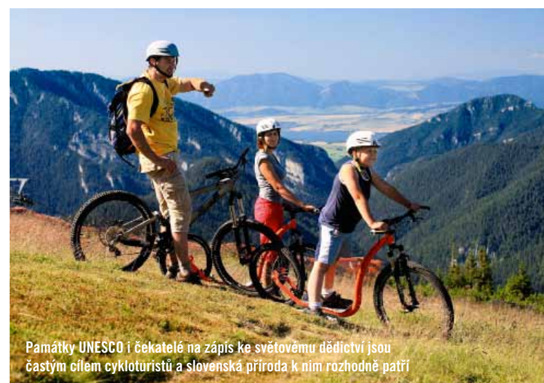
Památky UNESCO i čekatelé na zápis ke světovému dědictví jsou častým cílem cykloturistů a slovenská příroda k nim rozhodně patří