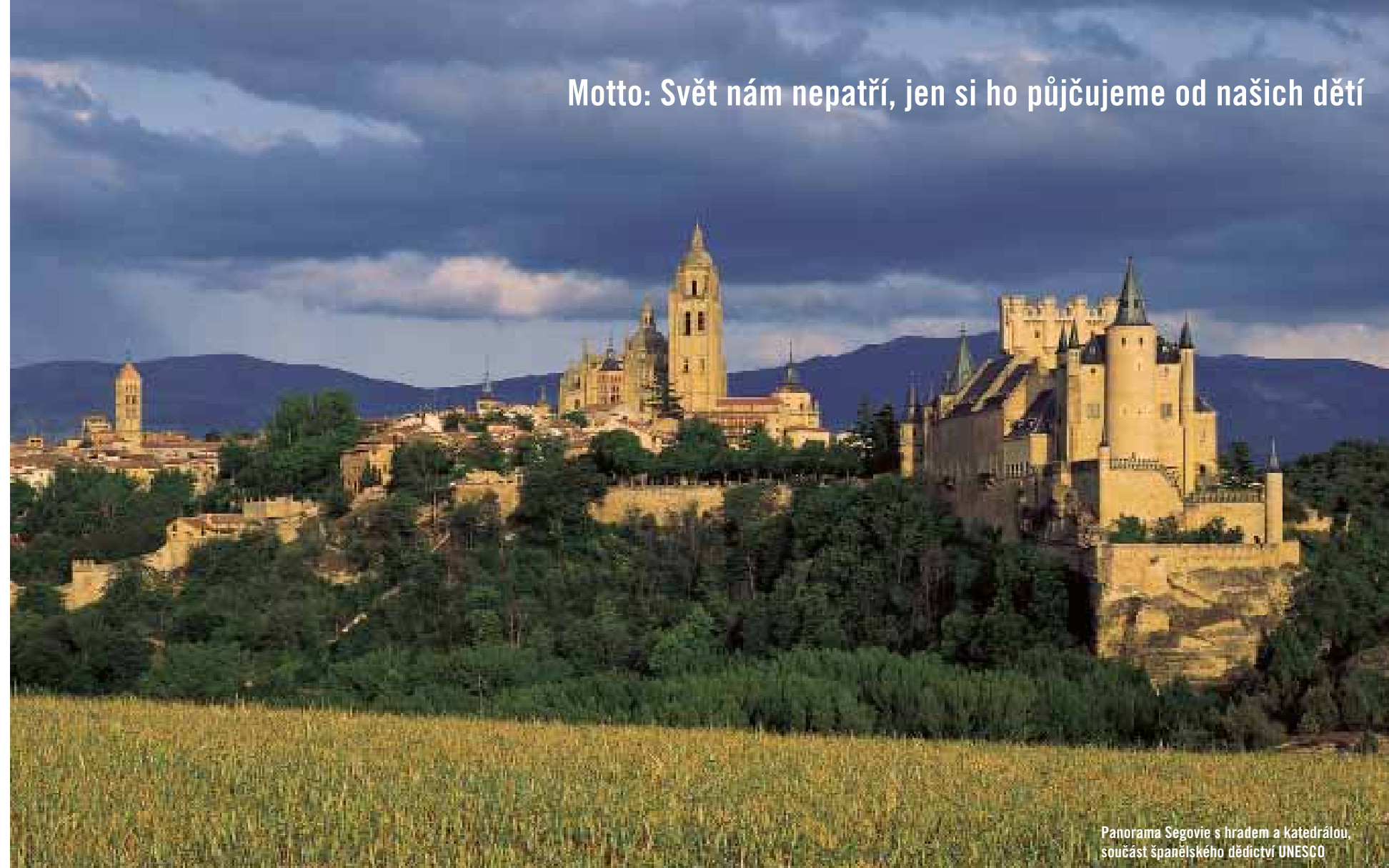
Panorama Segovie s hradem a katedrálou, součást španělského dědictví UNESCO

Motto: Svět nám nepatří, jen si ho půjčujeme od našich dětí