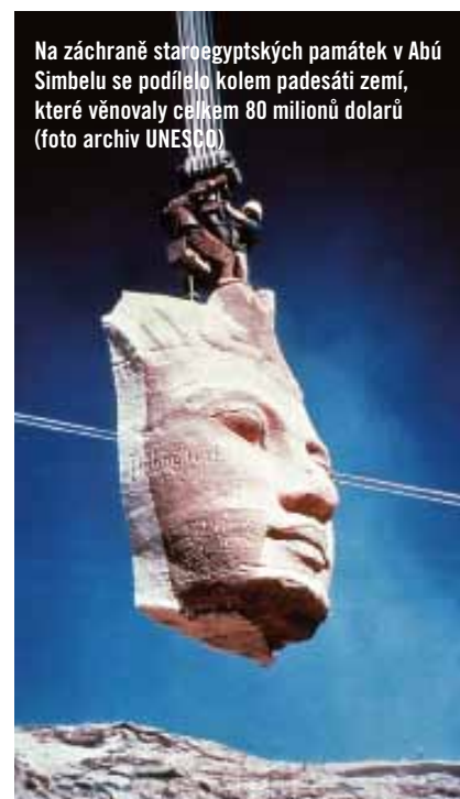
Na záchraně staroegyptských památek v Abú Simbelu se podílelo kolem padesáti zemí, které věnovaly celkem 80 milionů dolarů

vého dědictví zápis historického centra Prahy o Průhonický park, který koncem 19. století založil hrabě Arnošt Emanuel Silva-Tarouca. Odborníci park řadí k nejužšímu přírodně krajinářským celkům Evropy.