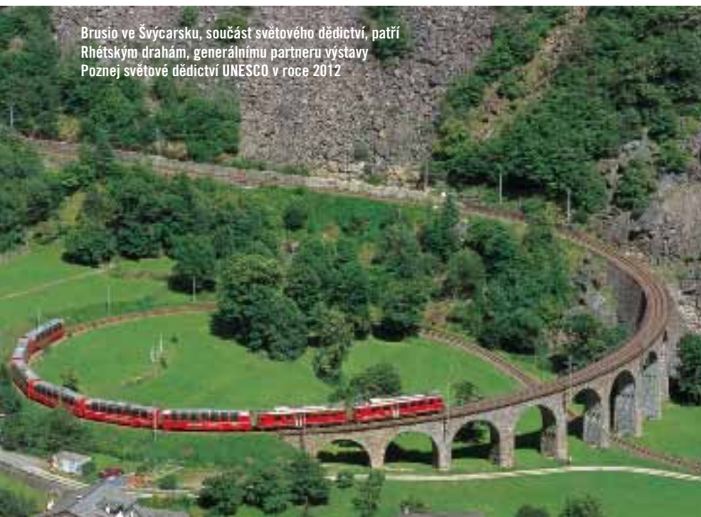
Brusio ve Švýcarsku, součást světového dědictví, patří Rhétským drahám, generálnímu partneru výstavy Poznej světové dědictví UNESCO v roce 2012