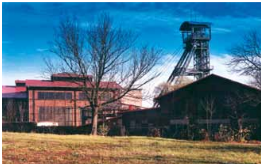
Národní kulturní památka Důl Michal

Hlubina, Vysokou pecí č. 1 a koksovnu Vítkovických železáren. Je jediným místem ve střední Evropě, kde mohou návštěvníci vstoupit do nitra vysoké pece. Z vyhlídkové plošiny ve výšce 60 m se naskýtá výhled na celou Ostravu a dál, až na Lysou horu. Oblibě veřejnosti se těší také další adepti – důl Anselm/Eduard Urx a celá lokalita