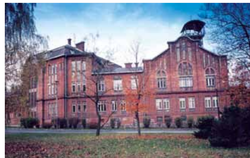
Národní kulturní památka Důl Michal

technických památek hornické a hutnické tradice, včetně dokladů, jak fungovala železniční doprava, sociální instituce nebo jak žili a bydleli horníci. Pracovníci Národního památkového ústavu vypracovali podklady potřebné k podání žádosti o přičlenění tohoto unikátního ostravského fenoménu ke světovému dědictví.