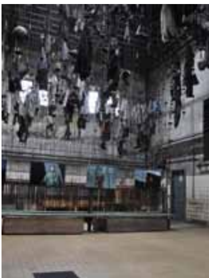
Řetízková šatna z let 1912–1915

Hlubina, Vysokou pecí č. 1 a koksovnu Vítkovických železáren. Je jediným místem ve střední Evropě, kde mohou návštěvníci vstoupit do nitra vysoké pece. Z vyhlídkové plošiny ve výšce 60 m se naskýtá výhled na celou Ostravu a dál, až na Lysou horu. Oblibě veřejnosti se těší také další adepti – důl Anselm/Eduard Urx a celá lokalita