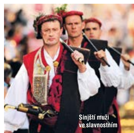
Sinjští muži ve slavnostním

UŽITEČNÉ ODKAZY: www.chorvatsko.hr www.unesco-media.in.cz www.kololod.cz www.croatiaairlines.com