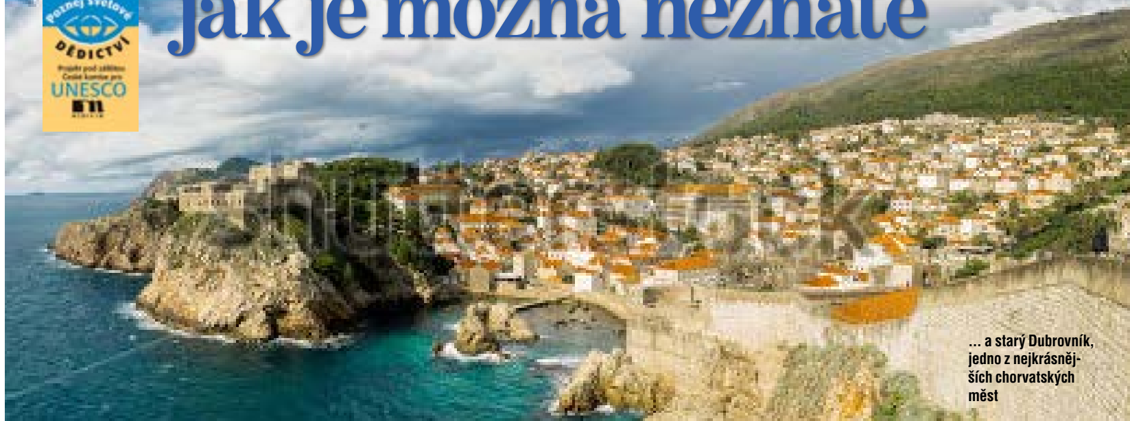
... a starý Dubrovník, jedno z nejkrásnějších chorvatských měst

Stěží bych spočítala, kolikrát jsem navštívila Chorvatsko, dřívější Jugoslávii. První cesty směřovaly za vytouženým mořem, ale záhy se pobyt na plážích Jadrana zkracovaly ve prospěch poznávání lidových tradic a kulturního i přírodního dědictví země. Právě díky počtu zápisů v seznamech UNESCO zaujímá Chorvatsko jedno z čelních míst v Evropě. TEXT MILENA BLAŽKOVÁ