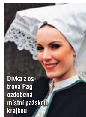
Dívka z ostrova Pag ozdobená místní pažskou krajkou