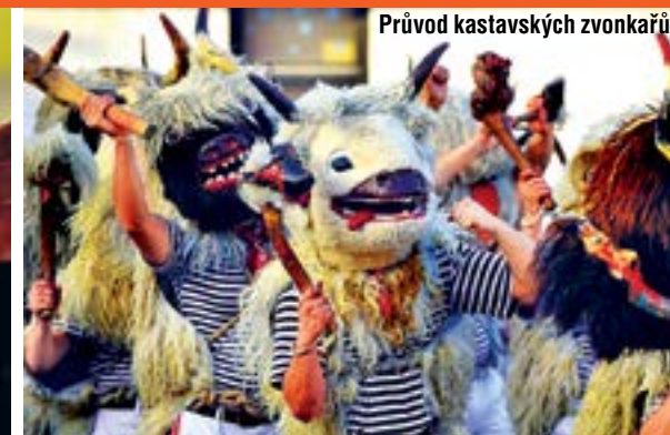
Průvod kastavských zvonkařů