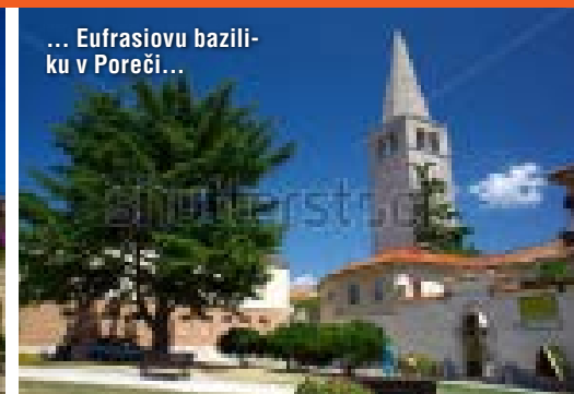
... Eufrazijsku baziliku v Poreči...