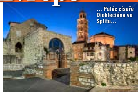
... Palác císaře Diokleciána ve Splitu...