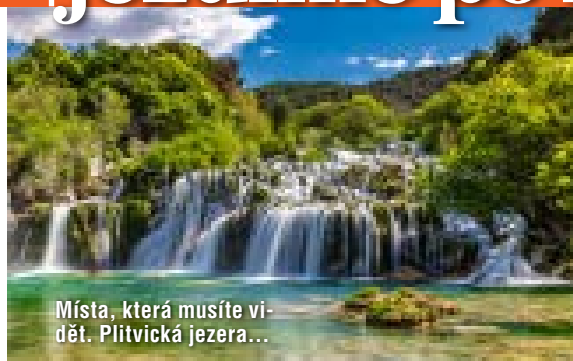
Místa, která musíte vidět. Plitvičská jezera...