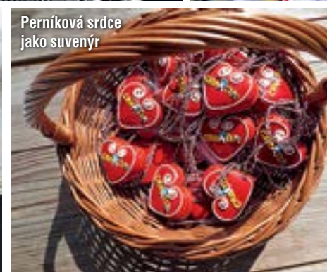
Perníková srdce jako suvenýr