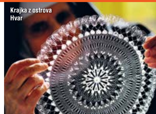
Krajka z ostrova Hvar