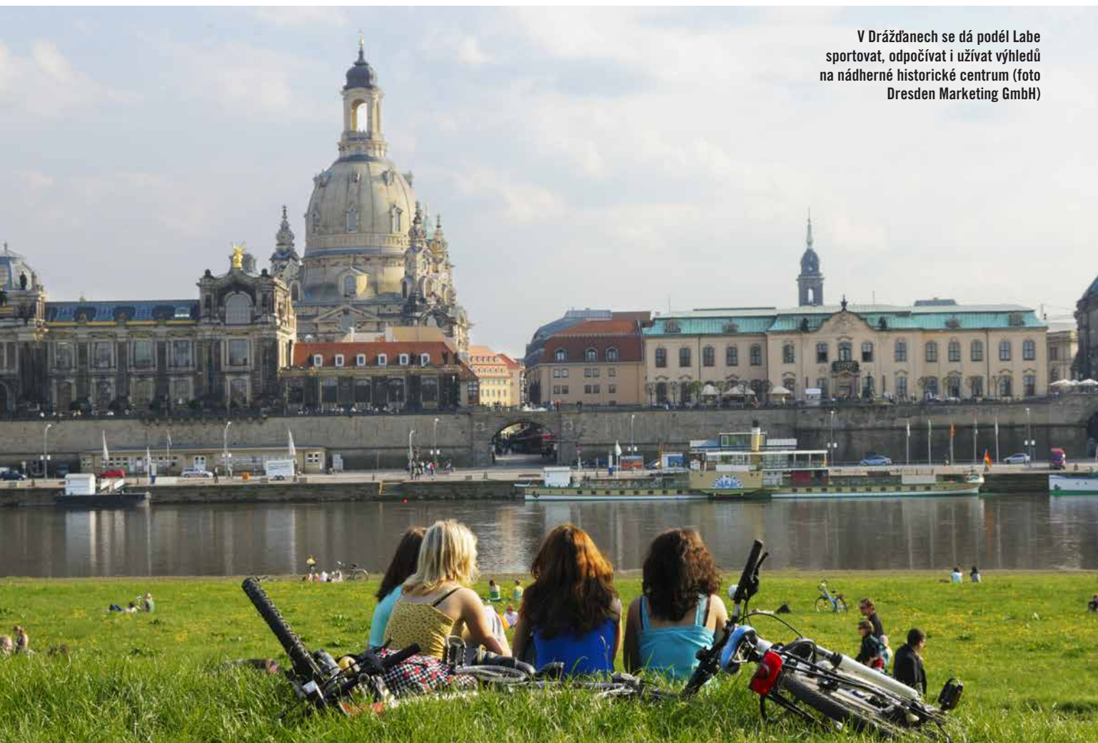
V Drážďanech se dá podél Labe sportovat, odpočívat i užívat výhledů na nádherné historické centrum