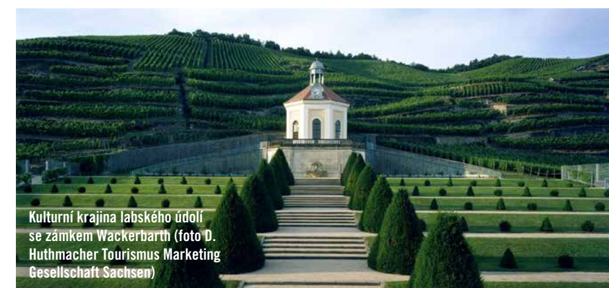
Kulturní krajina labského údolí se zámek Wackerbarth

Konec druhé světové války znamenal i konec nádherného hrdého města. Devastující kobercový nálet britských a amerických letadel začal 13. února 1945 ve 21.41 hodin, město následně tři dny a tři noci hořelo, o život přišel každý desátý obyvatel Drážďan. Ze Zwingeru, Semperovy opery a dalších stavebních skvostů, z budov typického drážďanského baroka s vysokými až pětipatrovými průčelími, strmými mansardovými střechami a ozdobnými vikýřovými okny, i z tisíců obyčejných staveb zbyla jen hromada sutin a kamení. Nové Drážďany, tak jak je známe v současnosti po téměř sedmdesáti letech od své zkázy, doslova povstaly z popela.