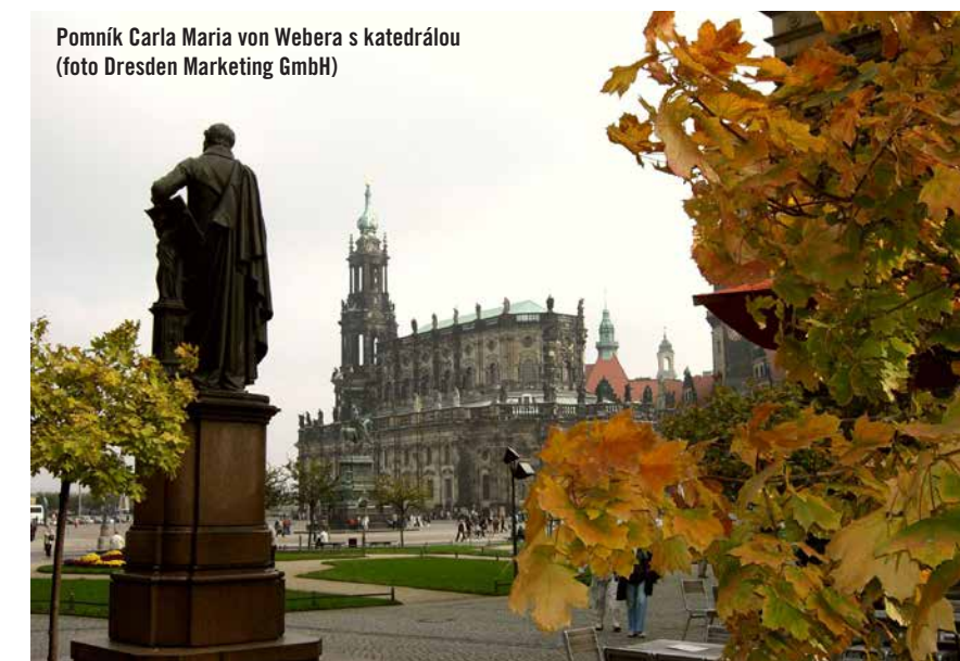
Pomník Carla Maria von Webera s katedrálou

Drážďany si potrpí na tradice a svět jim vděčí za mnohé. Začaly s výrobou porcelánu, světlo světa spatřila v Drážďanech první jednooká zrcadlovka, jedna místní hospodyně