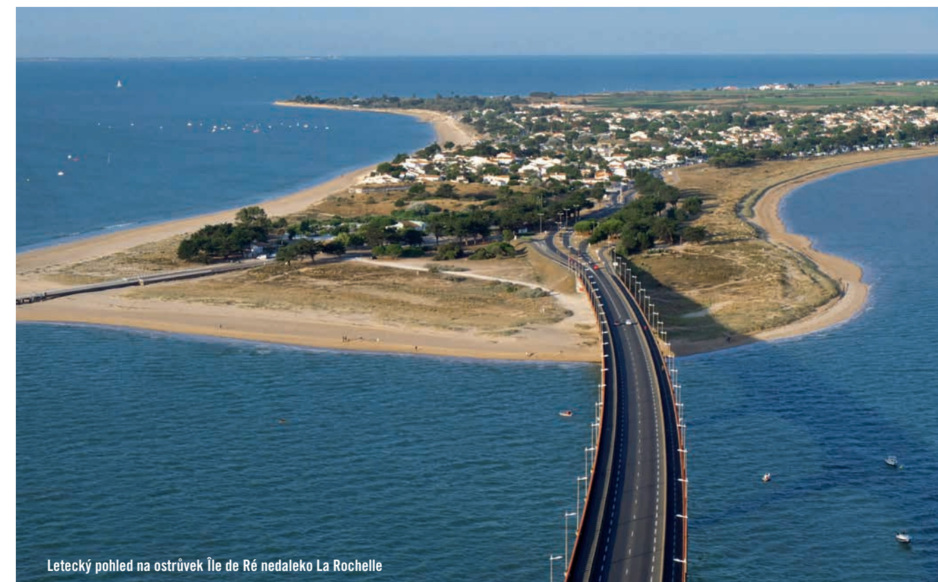
Letecký pohled na ostrůvek Île de Ré nedaleko La Rochelle

Pravidelně vás na těchto místech zveme na výstavy fotografií projektu Poznej světové dědictví UNESCO, které představují unikátní památky. Po celý květen je kompletní výstava k vidění v Domě kultury v Teplicích, její část, Slovenské dědictví UNESCO včetně fotografií čekatelů na tento prestižní zápis, si můžete až do 14. června prohlédnout ve vstupních prostorách radnice v Telči, na náměstí Zachariáše z Hradce. Vstup na výstavy zdarma, k dispozici jsou informační brožury o místech a zemích na fotografiích. Z evropských destinací se představí kromě Slovenska Švýcarsko, Salcburk, Chorvatsko, ze severní Afriky Tunisko a celá plejáda zemí jihovýchodní Asie. Jste srdečně zváni.