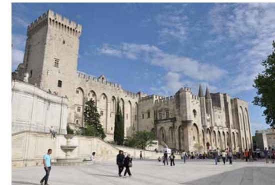
Papežský palác v Avignonu ( www.palais-des-papes.com )

Po vzoru panovníků si honosná sídla stavěli i zástupci šlechty; do této kategorie spadá Villandry, Saumur nebo Azay-de-Rideau. Villandry, poslední velkolepý renesanční zámek vybudovaný v údolí Loiry s proslulými zahradami, skvěle ilustruje architekturu 16. století. Zahrady uvedl do původní nádhery počátkem minulého století Joachim Carvallo a v této záslužné práci dodnes pokračuje jeho vnuk. Když jsem se před několika lety