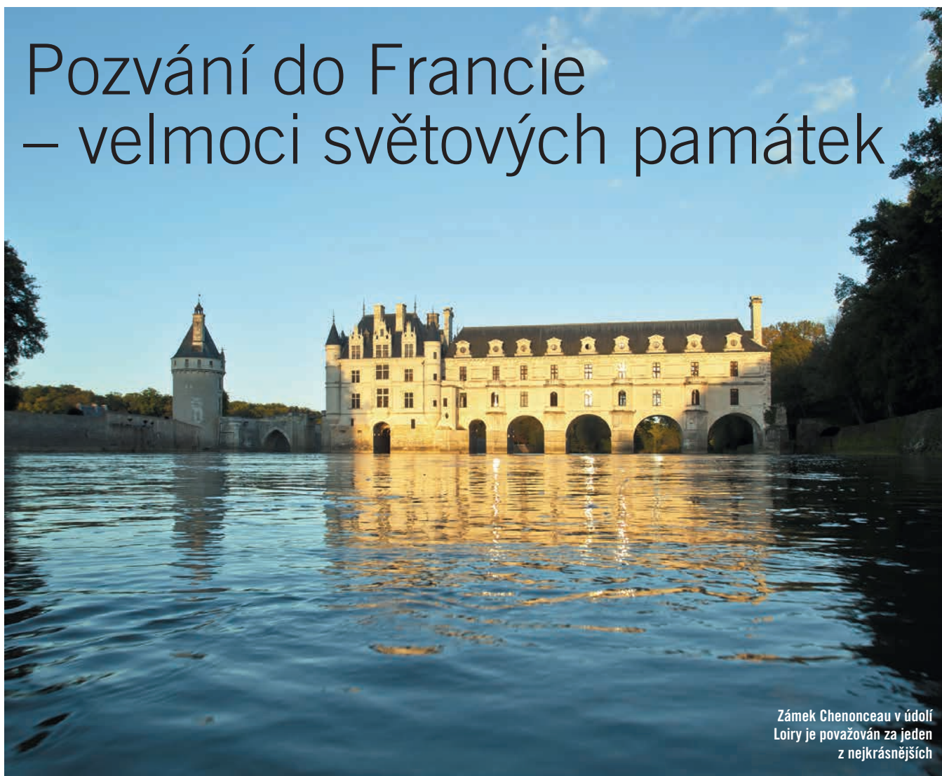
Zámek Chenonceau v údolí Loiry je považován za jeden z nejkrásnějších

text Milena Blažková, autorka projektu Poznej světové dědictví UNESCO, foto Atout France