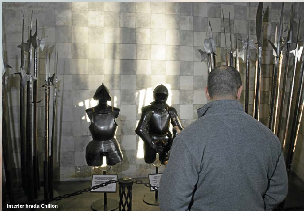
Interiér hradu Chillon

Návštěva Chillonu platila ve své době za poctu svobodě. K místu, kde trpěl Bonivard, se přijel pomodlit slavný spisovatel Alexander