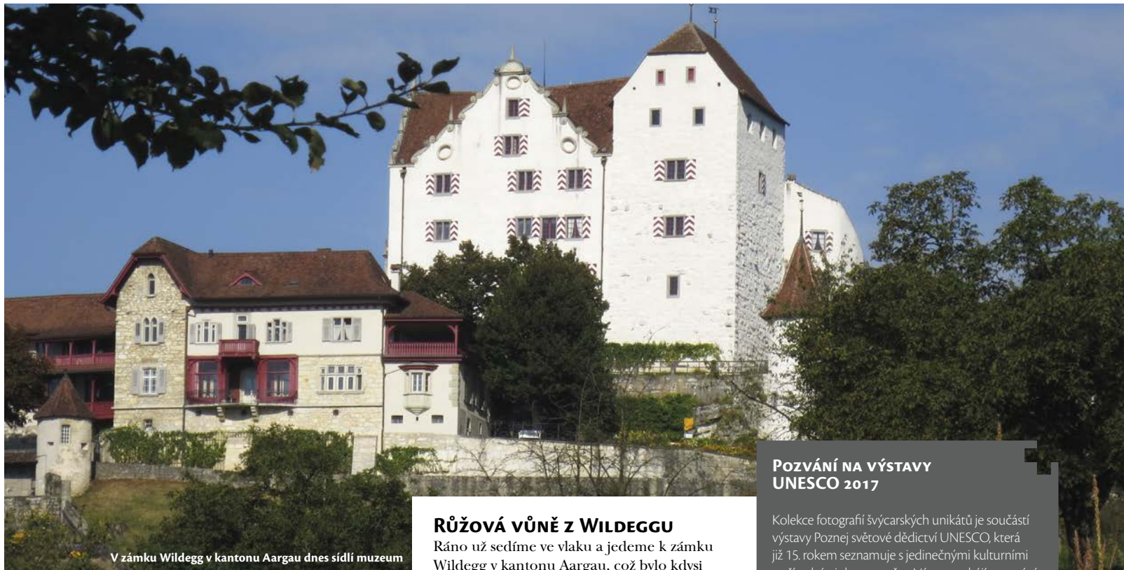
V zámku Wildeggu v kantonu Aargau dnes sídlí muzeum

regionu. Ředitelka muzea, archeoložka Lilian Raselli, nás zasnívá nejen do dávné historie kraje, ale i do budoucích plánů muzea. Bere nás na hradby s výhledem na město a při ochutnávce místních specialit, kterou pro nás nachystala, vypráví. Teprve potom s námi prochází pěti patry renomovaného muzea a ukazuje, jak náročnou a nákladnou rekonstrukcí zámek prochází. Ve vsí kráse už vyniká rytířský sál se stropem v sedmimetrové výšce, nové expozice i opravená věž, pozornost věnujeme i stylovému hotelu se čtrnácti nevšedními pokoji.