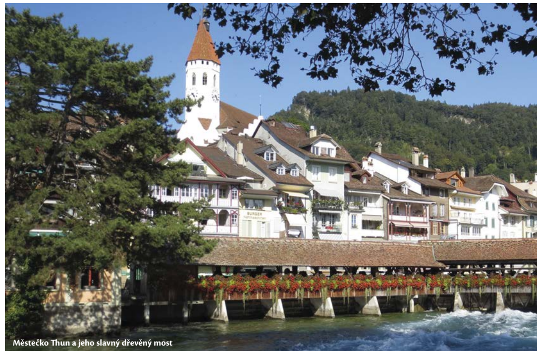
Městečko Thun a jeho slavný dřevěný most

U Thunského jezera ještě zůstáváme, čeká nás návštěva nevelkého zámku rodu Zähringerů, původně pevnosti z 12. století. Zdobený čtyřmi věžemi a dominantním donjonem ční vysoko nad malebným městečkem rozloženým kolem řeky Aare. I tento objekt, kam ročně zavítá asi 50 000 návštěvníků, plní funkci moderního muzea – mapuje čtyři tisíce let dějin celého