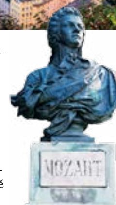
Mozartovy sochy jsou po celém městě

Romantickým duším doporučuji večeři při svíčkách s koncertem, která se koná v nádherných prostorách barokního sálu benediktinského kláštera sv. Petra v restauraci Stiftskeller. Ta je považovaná za nejstarší v Evropě – první zmínky o ní pocházejí už z roku 803. Chodila sem i Mozartova rodina. Ocitnete se