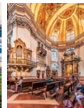
Večeře s koncertem ve Stiftskeller, v barokním sále opatství sv. Petra

množství unikátních exponátů dokumentujících tisíc tři sta let dlouhou historii města. Tematicky zaměřené prohlídkové trasy vedou třemi podlažími přes reprezentativní sály salcburské Rezidence, rezidenční galerii, chrámové muzeum, k okruhu patří i barokní sbírky Rossacher Salcburského muzea. V nejstarší barokní části paláce našlo zázemí nově zrekonstruované Muzeum sv. Petra, jehož expozice se věnují historii nejstaršího kláštera v německy mluvících zemích. Prohlídka zahrnuje také Františkánský kostel, jeden z nejstarších ve městě. Všech pět zajímavých institucí DomQuartieru absolvují návštěvníci s jedinou vstupenkou a jako bonus se jim z terasy nad průčelím chrámu otevírají nádherné pohledy na historické jádro města.