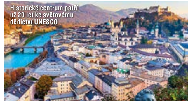
Historické centrum patří už 20 let ke světovému dědictví UNESCO

Po dlouhých dvě stě let byla památka uzavřená veřejnosti, nyní již druhým rokem platí DomQuartier, bývalé centrum moci knížecích arcibiskupů, za kulturní centrum Salzburgu. Komplex s arcibiskupským palácem, katedrálou a opatstvím sv. Petra se spoustou muzeí a sbírek vystavuje pod jednou střechou ohromné