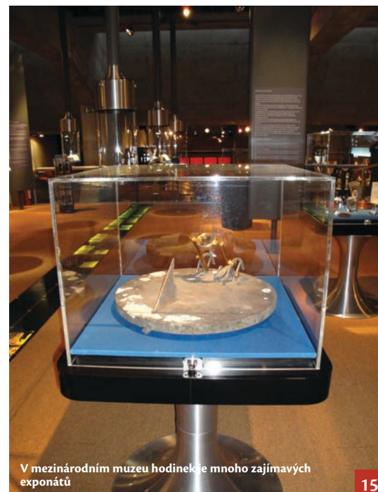
V mezinárodním muzeu hodiněk je mnoho zajímavých exponátů