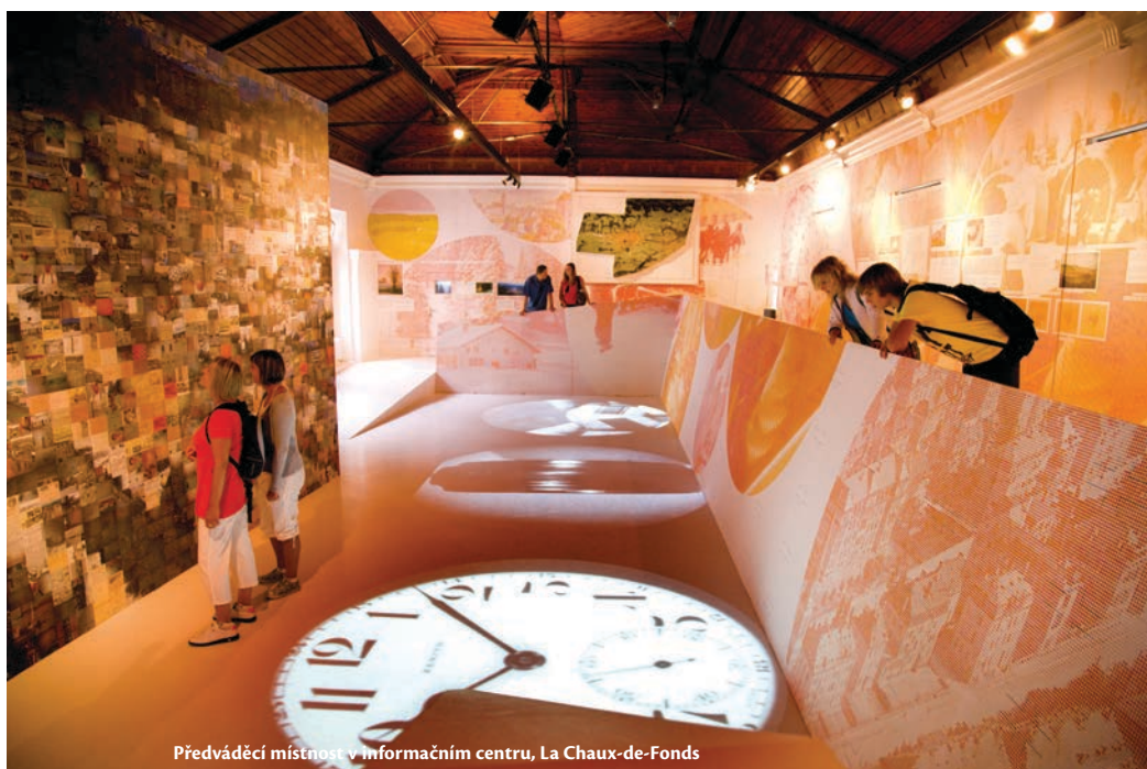
Předváděcí místnost v informačním centru, La Chaux-de-Fonds