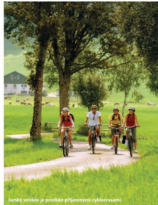
Jurský venkov je protkán příjemnými cyklotrasami

i do zdejších izolovaných končin dorazila řada technických vymožeností představených na světové výstavě v americké Philadelphii v roce 1876. Ruční práci z větší části nahradila strojová výroba – první továrna na výrobu hodinek tady vznikla již v roce 1880 – a hodinky z Le Chaux-de-Fonds začaly být ve světě žádané.