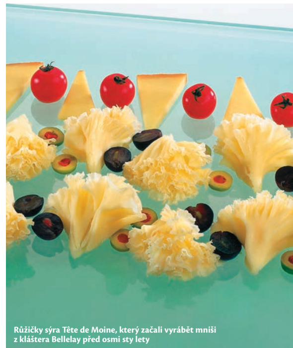
Růžičky sýra Tête de Moine, který začali vyrábět mniši z kláštera Bellelay před osmi sty lety

Od Neuchâtelského jezera už to není daleko k francouzským hranicím, v jejichž blízkosti se nabízejí další možnosti zastávek na hodinářské cestě: muzea v Ste-Croix, L'Auberson, Fleurier, Môtiers nebo Travers. Oblast je protkaná cyklostezkami, řada z nich začíná a končí v nádherném lázeňském městečku Neuchâtel, hodinářská historie se dá i velmi příjemně poznávat na bicyklech.