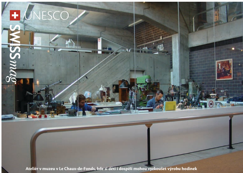
Ateliér v muzeu v Le Chaux-de-Fonds, kde si děti i dospělí mohou vyzkoušet výrobu hodinek