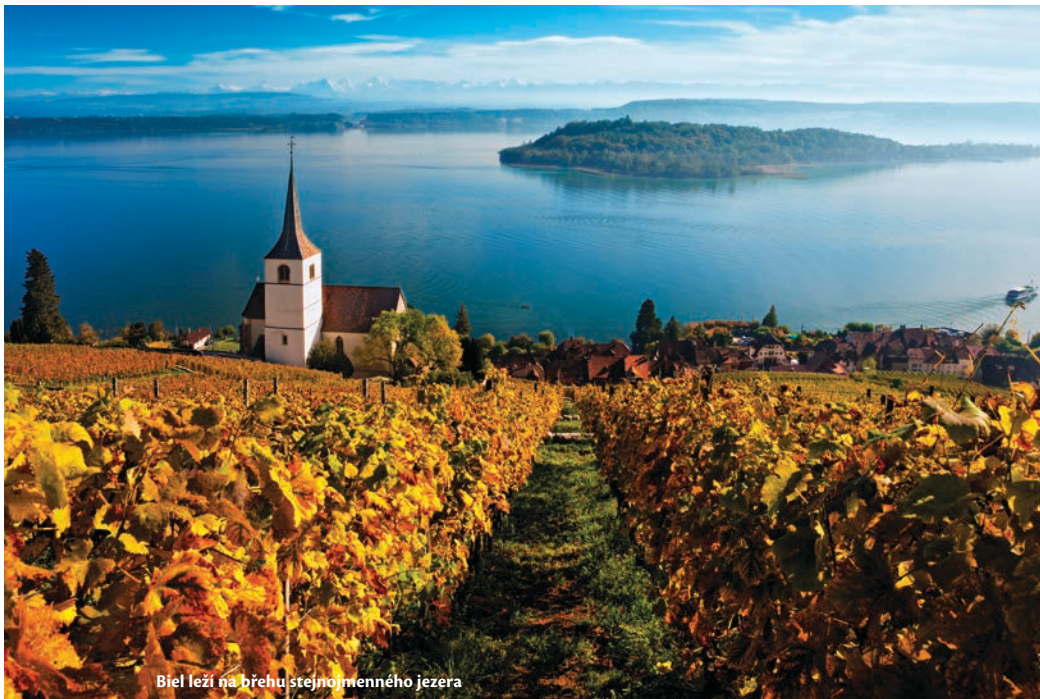
Biel leží na břehu stejnojmenného jezera