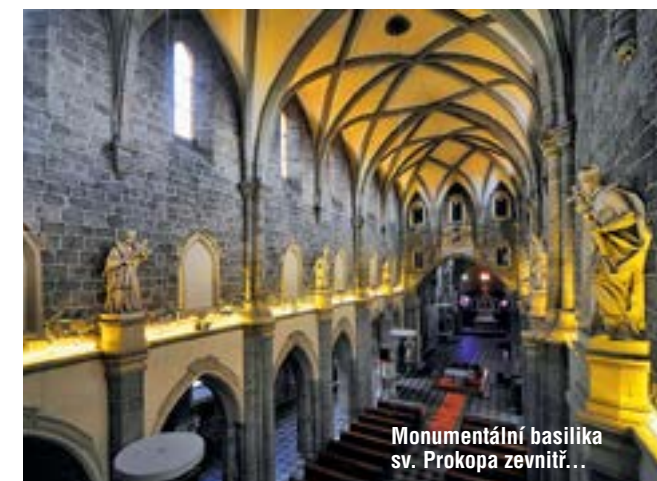
Monumentální bazilika sv. Prokopa zevnitř...

Počátkem devadesátých let minulého století padlo rozhodnutí zanedbanou čtvrť strhnout. Naštěstí město od záměru ustoupilo a s pomocí zahraničních financí podpořilo nákladnou opravu. Zdařilou rekonstrukcí prošla i Zadní synagoga, dnes významný třebíčský kulturní stánek. Její interier zdobí vzácné barokní malby s hebrejskými liturgickými texty, v atraktivním prostředí se konají festivaly židovské kultury, výstavy a koncerty. Udržuje se i dávné pohřebiště nad městem s třemi tisíci náhrobků, které patří k největším a nejhezčím židovským hřbitovům v republice a je chráněno jako národní kulturní památka. S přicházejícími umělci, uměleckými řemeslníky, nově vznikajícími obchůdky, dílnami, galeriemi i hospůdkami se do starobylého Záměstí pomalu vracel život.